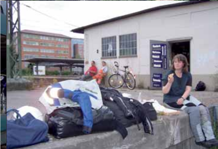
... wir verkürzen uns die Wartezeit mit Pizza.