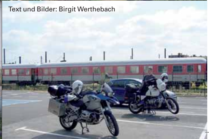
Die ersten Meter auf französischem Boden: am Bahnhof Narbonne

nicht nur landschaftlich sehr abwechslungsreich, sondern auch sehr reich an Kulturdenkmälern. Ein „Muss“ für jeden Reisenden ist die Festungsstadt Carcassonne, die ebenso wie der im 17. Jahrhundert erbaute Canal du Midi zum UNESCO-Weltkulturerbe zählt.