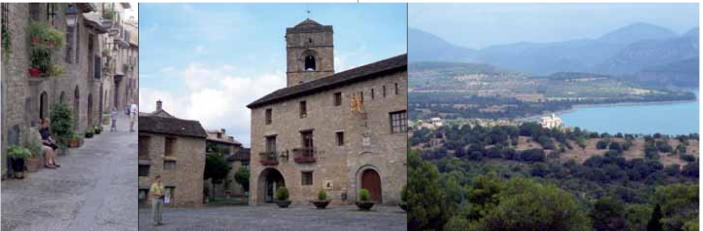
Abendlicher Plausch „auf der Gass“ in Ainsa