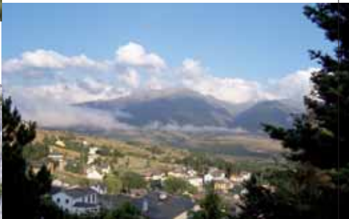
Blick aus Font Romeu ins Tal