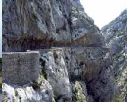
In den Felsen gehauene Straßen in der Galamus-Schlucht