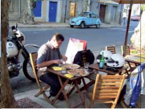
In Fabrezan gibt es nicht nur tolle Pizza: Der Wirt spricht sogar freiwillig Englisch