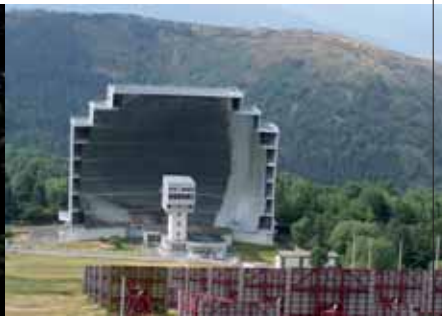
Gigantisch: Das Feu Solaire in Odeillo

fen sie auf das Herzstück der Anlage, einen gigantischen Parabolspiegel, der im Brennpunkt Temperaturen von bis zu unvorstellbaren 3800 Grad erreicht. Warum diese zu wissenschaftlichen Zwecken genutzte Riesenanlage ausgerechnet in einem Bergdorf in den Pyrenäen gebaut wurde, ist einfach erklärt. Mit rund 3000 Stunden im Jahr scheint die Sonne hier länger als überall sonst in Frankreich.