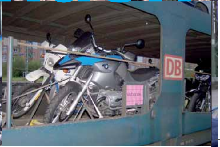
Autozugterminal Kornwestheim: Die Mopeds sind verladen...