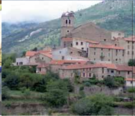
In den Bergen ist es kalt und wolkig: Das Dörfchen Mosset