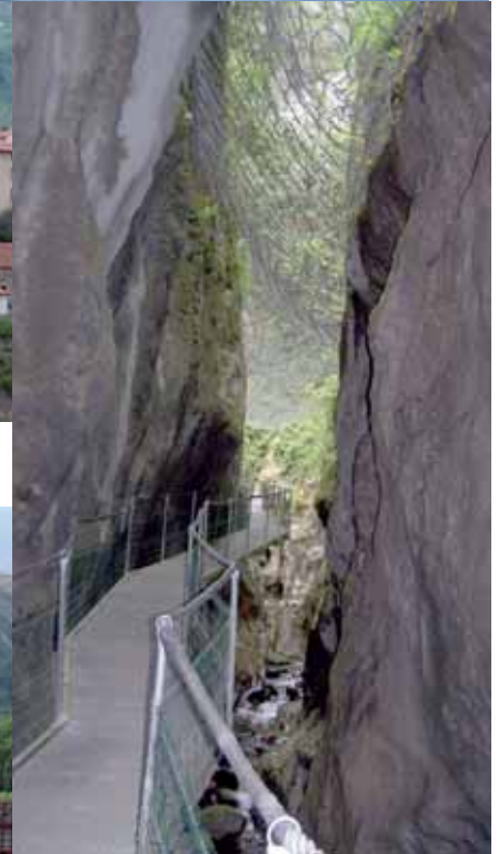
Das Tageslicht ist ganz weit oben im „Schorsch“ de la Fou