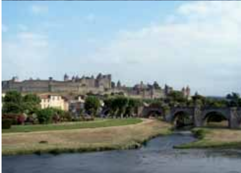
Auch von weitem sehr imposant: Carcassonne