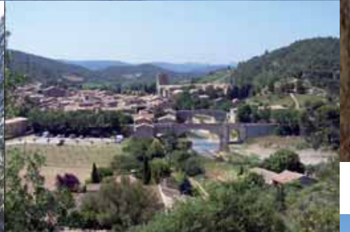
Das malerische Städtchen Lagrasse